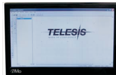
Сенсорный ЖК-дисплей 10"