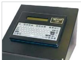
TMC420N Nema кожух