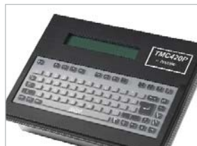
TMC420P установка в панель